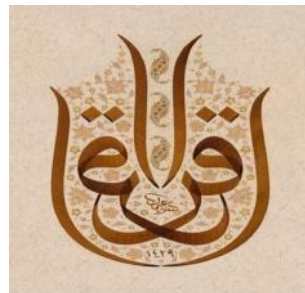
Gambar II 27

Gambar di atas merupakan contoh daripada Kaligrafi Arab Digital jenis kontemporer yang bertuliskan : ÈÓã Çááá ÇáÑÍáá ÇáÑÍáá / Bismillâhi al-râhmâni al-râhîm / dengan menyebut nama Allah yang Maha Pengasih lagi Maha Penyayang'. Gambar di atas sekilas terlihat seperti khat aulua , namun dalam penulisan pada huruf Ç ( alif ) dan á ( lâm ) tidak setegak khat aulua , dan huruf yang lainnya juga tidak mengikuti qâ'idah qâwâ'id yang ada pada khat aulua . Jadi, kaligrafi di atas dikategorikan kaligrafi Arab digital jenis kontemporer.