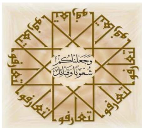
Gambar IV 34 .

Pada penulisan khat tsuluts ada beberapa huruf tertentu yang perlu mendapat perhatian khusus, yaitu alif karakteristik dari huruf alif pada khat aulua lancip (ا). Huruf 'ain penulisannya dimulai dalam bentuk sabit yang kemudian diisi dengan keruncingan pada ujungnya (أ). Huruf waw memiliki ukuran yang sama, ditulis dengan lebar penuh dari mata pena kemudian bulatan huruf diteruskan dengan ujung pena yang lancip (و). Pada huruf ha' akhir yaitu huruf ha' sambungan dari akhir kata ditulis seperti biasa, kemudian sepertiga pena diangkat sehingga hasil ujungnya bisa lebih tipis daripada bagian pertama dari huruf (ه).