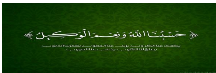
Gambar VI 39

wafat dalam tahun 338 Hijriyah. Kedua telah menciptakan kaidah dan aturan penulisan khat naskhi dengan menentukan ukuran panjang-pendek dan jarak huruf, serta gaya dan iramanya dengan rapi sekali. 37 Kaligrafi gaya naskhi paling sering dipakai umat Islam, baik untuk menulis naskah keagamaan maupun tulisan sehari-hari. Gaya naskhi termasuk gaya penulisan kaligrafi tertua. Sejak kaidah penulisannya dirumuskan secara sistematis oleh Ibn Muqlah pada abad ke-10, gaya kaligrafi ini sangat populer digunakan untuk menulis mushaf al-Qur'an sampai sekarang. Karakter hurufnya sederhana, nyaris tanpa hiasan tambahan, mudah ditulis dan dibaca. Penulisan khat naskhi tidak ada kekhususan dalam penulisannya selain kepala 'ain dan mim akhir dari jenis mursal . 38