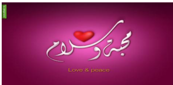
Gambar VIII 45

Ciri khas dari pada khat diwani lebih memprioritaskan pada lekuk sisi melengkung dan agak membulat terlihat gaya lengkungan pada tiap-tiap huruf-hurufnya. Susunan khat ini juga dapat dimasukkan sebagai bagian keindahan kaligrafi, kendatipun kurang diminati. Khat diwani ditulis seperti biasa, berbeda dari khat sebelumnya, karakteristik dari khat diwani yaitu terletak pada ujung dari beberapa huruf yaitu huruf. 43 Ciri khas dari khat diwani lebih memprioritaskan pada lekuk sisi melengkung dan agak membulat pada tiap tiap hurufnya. Susunan dan tumpukan pada penulisan khat ini juga dapat mempengaruhi keindahan. 44