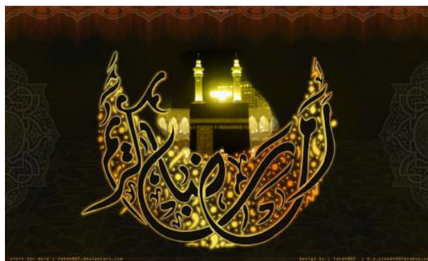
Gambar IX 48

Kaligrafi Arab di atas merupakan kaligrafi Arab digital jenis yang sesuai qâwâ'id yaitu mengikuti qâ'idah khat diwani jali yang bertuliskan: \tilde{N}\tilde{a}\tilde{O}\tilde{Ç}\tilde{a} Ç\tilde{a}B\tilde{N}\tilde{i}\tilde{a} / Ramadhân al karîm / 'Ramadhan yang Mulia'.