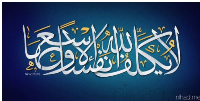
Gambar V 35

Gambar di atas merupakan kaligrafi Arab digital yang bertuliskan: \text{اَللّٰهُمَّ اِنِّىْ اَسْـَٔلُكَ بِاَنَّكَ اَنْتَ الْغَفُوْرُ الْوَهَّابُ} / \text{waja'alnâkum syu'uba wa qabâil lita'ârafû} / \text{Dan kami ciptakan kamu bersuku-suku dan berbangsa-bangsa agar kamu saling mengenal} (Q.S. Al-Hujarât /49: 13). \text{اَللّٰهُمَّ اِنِّىْ اَسْـَٔلُكَ بِاَنَّكَ اَنْتَ الْغَفُوْرُ الْوَهَّابُ} ditulis dengan menggunakan khat aulua yang merupakan bagian dari kaligrafi Arab digital jenis yang sesuai qawâ'id , namun pada kalimat \text{اَللّٰهُمَّ اِنِّىْ اَسْـَٔلُكَ بِاَنَّكَ اَنْتَ الْغَفُوْرُ الْوَهَّابُ} ditulis dengan menggunakan khat kufi yang merupakan bagian dari kaligrafi Arab digital jenis yang sesuai qawâ'id , dan ditulis berulang kali dan mengelilingi kalimat pertama sehingga membentuk sebuah ornamen.