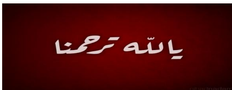
Gambar XI 55

Kaligrafi ini dinamakan Riq'ah karena sesuai dengan gaya penulisannya yang kecil-kecil serta terdapat sudut siku-siku yang unik dan indah. Khat ini kadang-kadang disebut juga khat Ruq'ah (sesobek, secuil), yang merupakan nama lama dari jenis ini. Khat riq'ah merupakan salah satu khat yang kurang cocok jika diberi syakal dan hiasan, sebab lebih digunakan pada penulisan steno atau cepat. Contohnya untuk catatan sekolah atau wartawan. Lagi pula, jenis ini kurang cocok untuk tulisan kegiatan resmi, apalagi hiasan dekorasi. Khat ini kurang luwes dipakai dalam lukisan karena lebih banya terikat dengan kaidah penulisannya yang di atas garis meskipun ada beberapa huruf yang sebagai di bawah garis. 52 Jenis khat riq'ah yang disebut juga khat riq'ie adalah tulisan Arab yang dapat ditulis dengan cepat, mendekati kecepatan stenografi. Sebab itu, khat riq'ah ini banyak dipergunakan dalam lingkungan perguruan tinggi Islam seperti Universitas al-Azhar dan Dâr al-'Ulûm Kairo, demikian juga pada berbagai madrasah. Para dosen dan mahasiswa dalam kegiatan kuliahnya kebanyakan mempergunakan khat riq'ah . 53 Kaligrafi gaya riq'ah merupakan hasil pengembangan kaligrafi gaya naskhi dan tsuluts . Sebagaimana halnya dengan tulisan gaya naskhi yang dipakai dalam tulisan sehari-hari. 54 Kaligrafi riq'ah ditulis dengan karakteristik alami, tidak memiliki variasi lukisan, kecuali pada ujung beberapa huruf yang dilukis sekedar untuk kesempurnaan, dengan ujung mata pena.