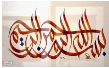
Gambar I. 26

Gambar di atas merupakan contoh daripada Kaligrafi Arab Digital jenis kontemporer yang bertuliskan : ÈÓã Çááá ÇáÑÍáá ÇáÑÍáá / Bismillâhi al-râhmâni al-râhîm / dengan menyebut nama Allah yang Maha Pengasih lagi Maha Penyayang'. Gambar di atas sekilas terlihat seperti khat aulua , namun dalam penulisan pada huruf Ç ( alif ) dan á ( lâm ) tidak setegak khat aulua , dan huruf yang lainnya juga tidak mengikuti qâ'idah qâwâ'id yang ada pada khat aulua . Jadi, kaligrafi di atas dikategorikan kaligrafi Arab digital jenis kontemporer.